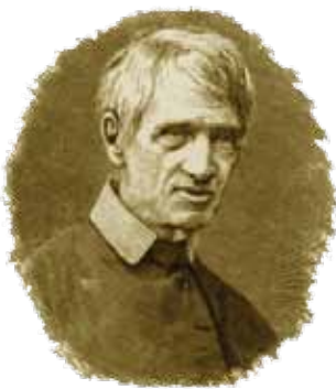
Card. John Henry Newman